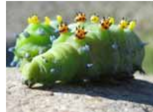
Québec Couleur nature 2006

Étant donné le succès du concours photo Québec couleur nature l'an dernier, Nature Québec, en partenariat avec Géo Plein Air, entend répéter l'aventure. Soyez à l'affût! Tout les détails suivront bientôt sur le site Internet de Nature Québec / UQCN ( www.naturequebec.org/quebeccouleurnature ) et dans la prochaine édition du magazine Géo Plein Air. Préparez vos caméras !