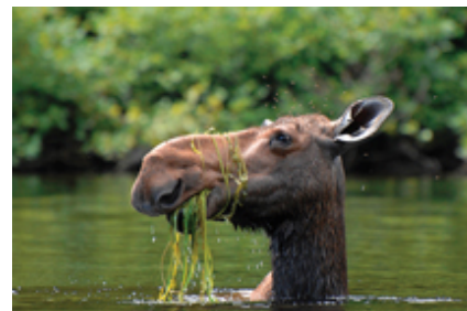
© Steve Deschênes, Québec Couleur nature 2007

Rendez-vous l'an prochain pour la 6 e édition de ce magnifique concours.