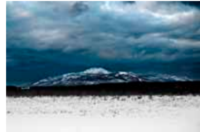
© Québec couleur nature 2008, Jérôme Guibord