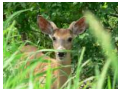
© Québec couleur nature 2006, Patrick Lalonde

La coalition pour la protection de l'île Charron, dont Nature Québec est membre, a rendu publique une étude commandée au Forum Urba 2015 de l'UQAM. Cette étude révèle que les contraintes liées au développement du terrain, appartenant à Investissement Luc Poirier, sont tels qu'ils réduisent leur valeur commerciale. Les limites du règlement de zonage, les contraintes liées à la présence de 10 hectares de milieux humides et les coûts liés au développement d'infrastructures, à l'aménagement, à la mise en place des services collectifs, sans compter les impacts sur le transport et sur l'environnement, doivent être pris en compte dans la négociation pour l'achat du terrain par le gouvernement du Québec dans le but de l'annexer au parc national des Îles-de-Boucherville.