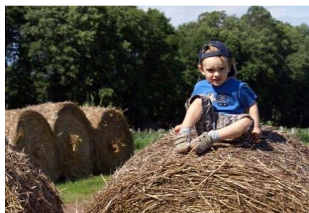
© Québec couleur nature 2008, Andrée-Louise Beaulieu

Pour Nature Québec, il est temps que le gouvernement propose à la société québécoise un changement en profondeur des politiques agricoles afin d'assurer la viabilité à long terme des entreprises agricoles, des communautés rurales et des écosystèmes. Dans son mémoire, soumis dans le cadre des consultations publiques du Livre vert sur la politique bioalimentaire qui ont lieu cet automne, Nature Québec mentionne vouloir une agriculture diversifiée qui remplit plusieurs fonctions, y compris écologiques.